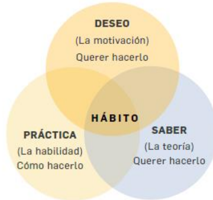
Figura 18. Cómo formar hábitos con efectividad