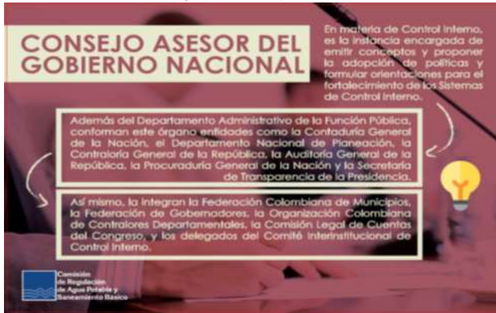
Imagen 14. Pieza publicada.