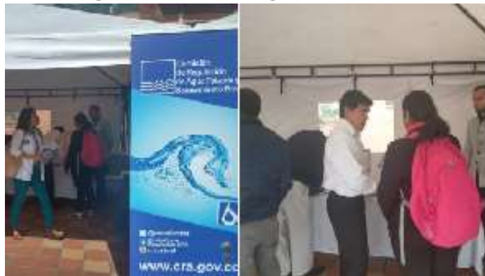
Imagen 4. Feria de Legalidad Ambiental