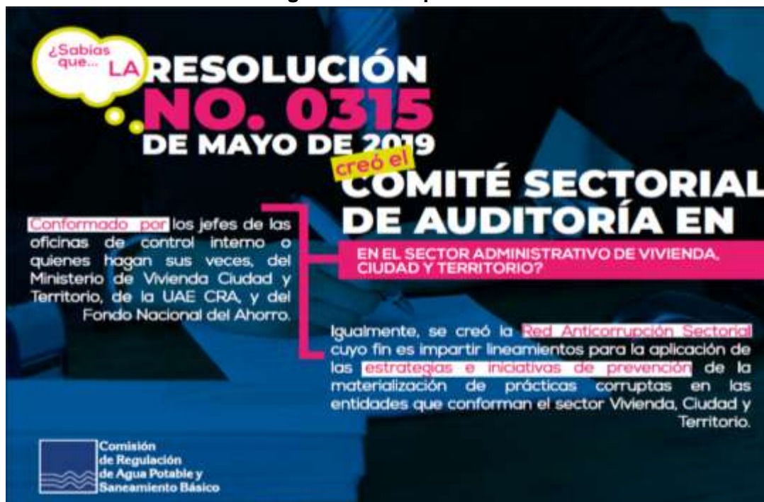
Imagen 15. Pieza publicada.