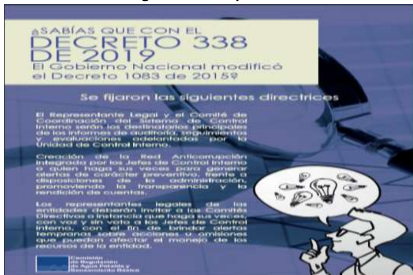
Imagen 13. Pieza publicada.