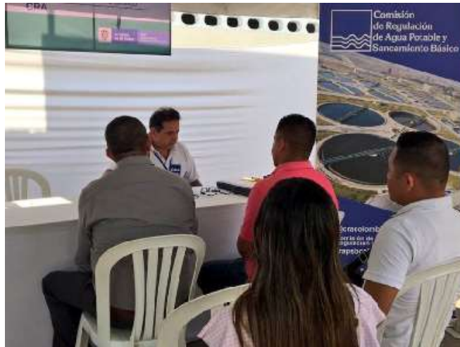
Imagen 3. Participación en Aracataca (Magdalena).

Adicionalmente, la Comisión participó el 17 de junio de 2019, en la Feria de Legalidad Ambiental, evento organizado por las Empresas Públicas de Cundinamarca y EPC y la Corporación Autónoma Regional CAR. En este escenario la Comisión prestó atención a la ciudadanía sobre temas regulatorios en servicios públicos.