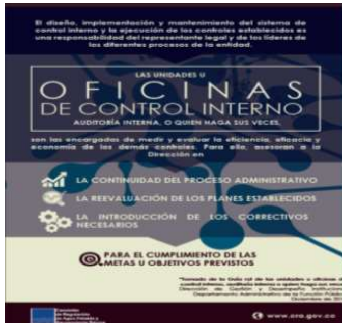
Imagen 12. Pieza publicada.