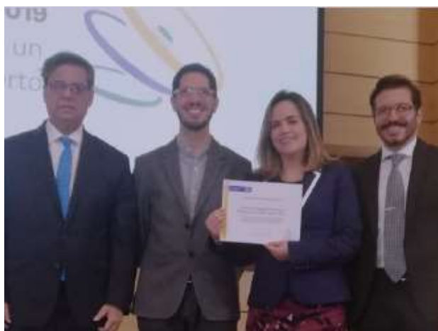
Imagen 6. Concurso Nacional De Rendición De Cuentas

La entidad, obtuvo entre 26 entidades postulantes a esta categoría, el puesto No. 3, con el cual recibió un reconocimiento por su gestión. La propuesta con la que participó la entidad, puede ser consultada en: https://youtu.be/iUwSuoObyvs