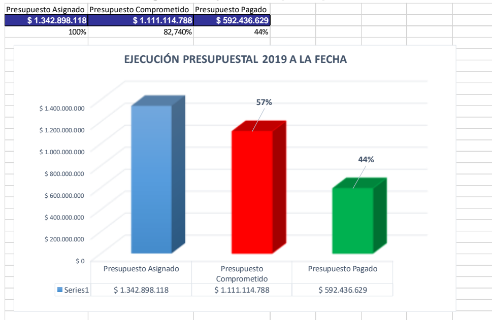
Imagen 10. Ejecución presupuestal.